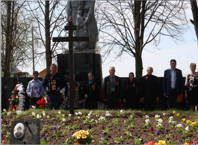
Братская могила в с. Недельное