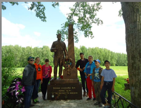
На братской могиле в д. Севрюково. 2016г

ЗА 8 ЛЕТ СОСТОЯЛОСЬ 15 ПОХОДОВ И ЭКСПЕДИЦИЙ УЧАЩИХСЯ ШКОЛЫ, ОРГАНИЗОВАННЫХ ШКОЛЬНЫМ МУЗЕЕМ