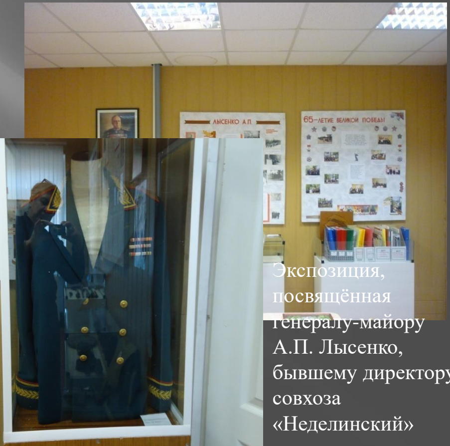
Экспозиция, посвящённая Генералу-майору А.П. Лысенко, бывшему директору совхоза «Неделинский»