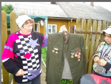
Экспедиция вд. Никольское. 2014 г