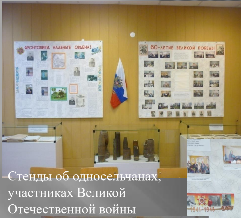
Стенды об односельчанах, участниках Великой Отечественной войны