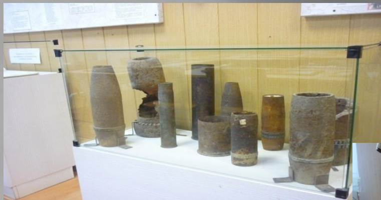
Фрагменты оружия и боеприпасов времён ВОВ