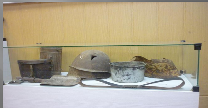
Снаряжение и экипировка времён ВОВ

В зале Боевой славы находится – 105 экспонатов подлинников и 83 из дополнительного списка