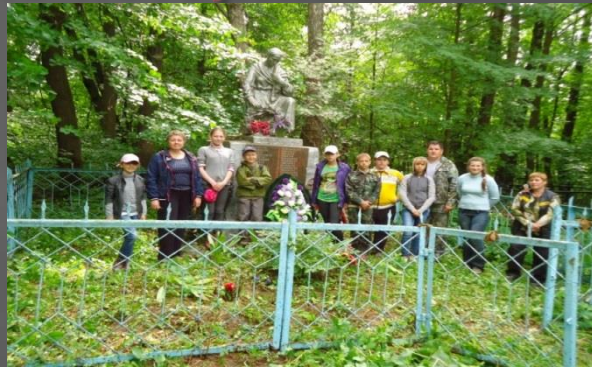
На братской могиле в д.Башмаковка. 2013 г.