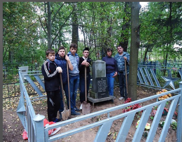
Братская могила на Казариновском кладбище. 2017г

ЗА 8 ЛЕТ СОСТОЯЛОСЬ 15 ПОХОДОВ И ЭКСПЕДИЦИЙ УЧАЩИХСЯ ШКОЛЫ, ОРГАНИЗОВАННЫХ ШКОЛЬНЫМ МУЗЕЕМ