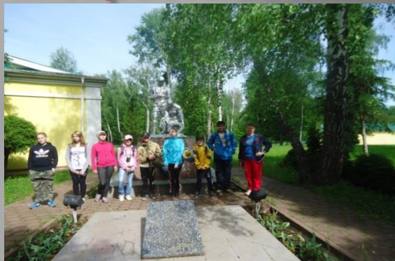
На братской могиле в СОБО «ЛЕСНОЕ». 2015 г.