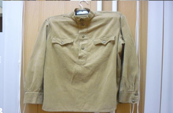
Солдатская гимнастёрка времён ВОВ

В зале Боевой славы находится – 105 экспонатов подлинников и 83 из дополнительного списка